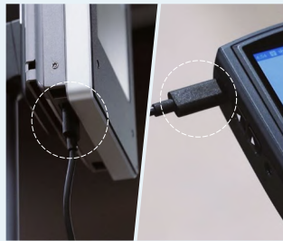
▲ 連動はUSBを繋ぐだけなので誰でも簡単に設定することができます

一般的にはアルコール検査情報は紙やPCに記録し、アナログで管理することが多いですが、毎日行う検査情報は膨大となり、1年間のデータ管理となると大変です。NSSの「アルコールチェッカー」は「アクセスコントロール&サーマルAIカメラ」と連動。対象者とその検査結果を紐付けし、自動的にデータが保存されるため、スムーズで簡単にデータ管理をすることが可能。