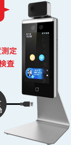
アクセスコントロール & サーマルAIカメラ