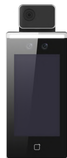
アクセスコントロール &サーマルAIカメラ