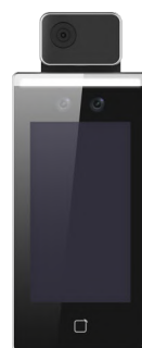
アクセスコントロール &サーマルAIカメラ